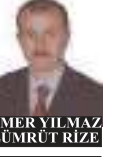
OMERYILMAZ ZÜMRÜT RIZE

"O yüzden buradan hem Çevre Bakanlığı yetkililerini hem de ilgili kurumları uyarıyoruz. Lütfen Rizelinin bu talebini görmezlikten gelmeyin ve bu projeyi durdurun. Pazar'da bu şirketlerin kazançları olacak diye halkın istemediği bir şeyi yaptırmayacağız. Demokratik gösteri hakkımızı da kullanacağız, hukuki yolları da arayacağız. Ardeşen'de, Fındıklı'da, Arhavi'de olduğu gibi vatandaşın yanında duracağız. O yüzden ilgilileri şimdiden uyarıyorum; bu sevdamız vaz geçin. Sayın Cumhurbaşkanı da muhtemelen haberi olmadığı, oğlunun kurucusu olduğu bir vakfın bu ticari işlerde ne işinin olduğunu sormasını özellikle çok isterim. Rizelilerin istemediği hiçbir şeyi yapmayın, kıyılar hepimizin, denizler hepimizindir. Çocuklarımızın yüzdüğü denizde bakterilere, cilt hastalıklarına maruz kalmasına neden olacak bu tehlikeleri durdurun diyoruz. Siz durdurmazsanız halk durduracak."