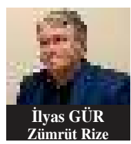
İLYAS GÜR Zümrüt Rize

Hakkari belediyesi Eş Başkanı Mehmet Sıddık Akış, 10 yıl önce çılmış bir soruşturma gerekçe gösterilerek Van'da gözaltına alınmış ve yerine Hakkari Valisi Ali Çelik atanmıştır. Belediye Eş Başkanı Akış'a soruşturma açan söz konusu dosyanın soruşturma savcısı ve hakimi şu anda FETÖ firarisi olarak aranmakta ve haklarında yasal işlem devam etmektedir. 10 yıl önce FETÖ terör örgüt üyesi olduğu iddia edilen savcı ve hâkimin açmış olduğu bir soruşturma gerekçe gösterilerek İçişleri Bakanı Ali Yerlikaya'nın talimatı ile Hakkari Belediyesi'ne kayyım atanmıştır. Bu durum bir hukuk garabetidir ve asla kabul etmiyoruz. Halkın iradesi ile seçilmiş bir belediye başkanı ve yönetimi ancak halkın iradesi ile geri alınabilir. Bunun dışında yapılan her türlü girişim hukuki olmadığı gibi meşru da değildir. Seçilmiş Belediye Eş Başkanı derhal serbest bırakılmalı ve görevine iade edilmelidir. Kayyımlar gidecek, biz kalacağız."